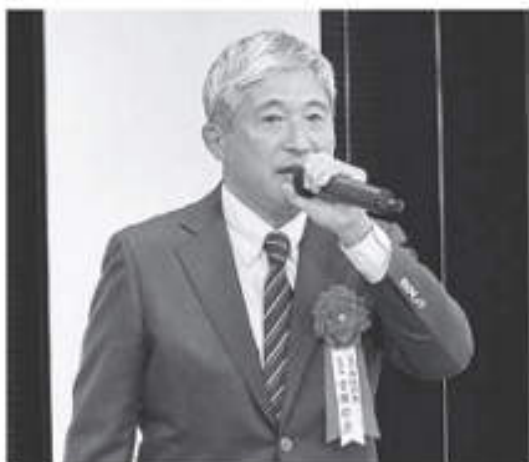
吉原 GP 推進部会長の挨拶