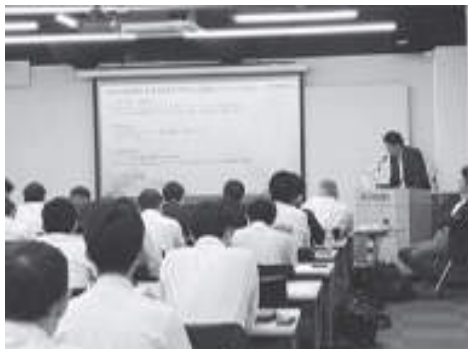
SCREENGP ジャパン様の講義の様子

秋季研修会では印刷技法に関する技術セミナーとして(株)SCREEN GP ジャパン様、富士機械工業(株)様より、それぞれ講師を招きEBオフセットの現状や最新グラビア印刷機の講義を開催しました。