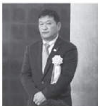
GPマーク普及大賞を受賞した巧芸社