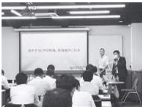
富士機械工業様の講義の様子

『短納期対応』『コスト高騰対応』においては、オフセット版は最大70枚/時で作成可能で、1版当たり800～1000円で製版することができ、版を保管する倉庫も不要とのことでした。