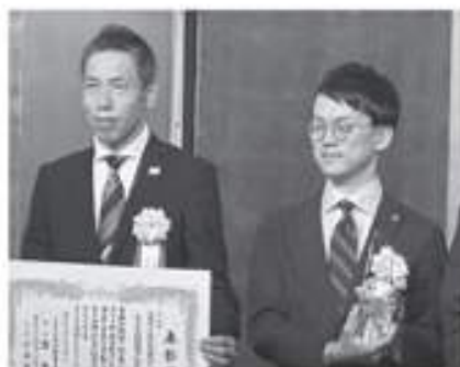
GPマーク普及大賞ゴールドプライズを受賞した北四国グラビア印刷